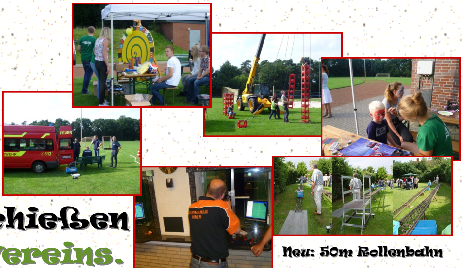
Neu: 50m Rollenbahn

Unterstützung durch die Feuerwehr und das Ortspokalschießen des Schützenvereins.